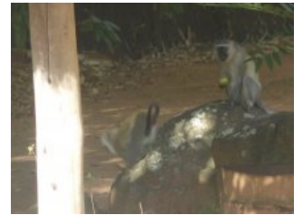
De bewuste apen