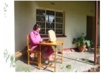
Omdat het koud was in huis, werkt de 'typiste' buiten