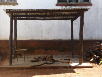
Overdekte kookplaats bij studenten (vrouwen) hostel