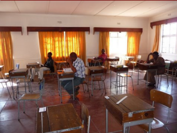
Examen lokaal MThC