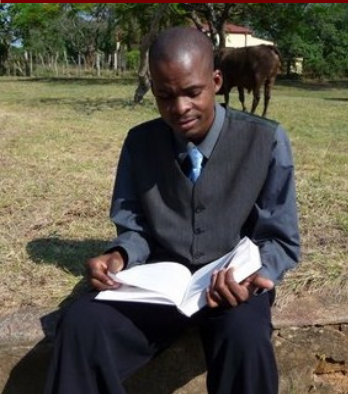
Student bezig met voorbereiding van examens