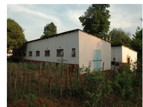
Studenten (mannen) hostel