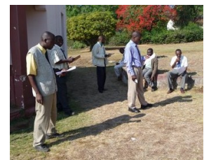
Studenten buiten bezig met voorbereiding